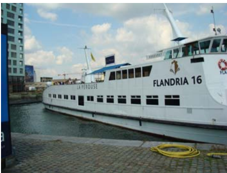
" La Pérouse "

In onze 16 feestlocaties -3 Kastelen - 3 party schepen en de hele FLANDRIA vloot inclusief Cruise Terminal Antwerpen